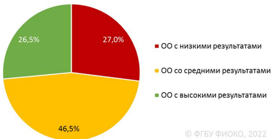
Рисунок 1. Распределение ОО по результатам (общероссийская выборка, 2021 г.)

При этом надо помнить, что образовательные результаты — это только один из показателей эффективности школы. Успешна ли школа в вопросах воспитания, профориентации? Зная ответы на эти вопросы, можно предположить, как работа школы сказывается на благополучии будущих выпускников.